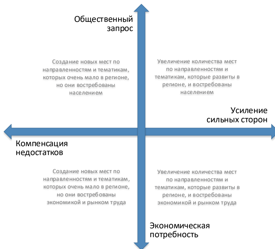
Рис. 2. Шкалы выбора тематики и тактики создания новых мест дополнительного образования