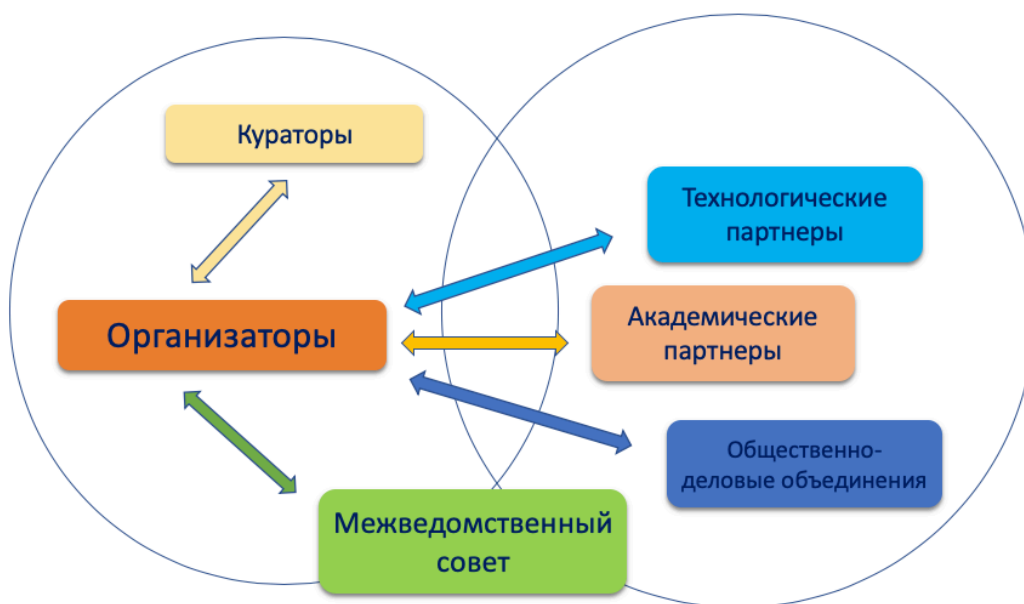
Рис. 1. Схема взаимодействия участников мероприятий по внедрению и функционированию типовой модели «Спортика»

Схема взаимодействия участников мероприятий по внедрению и функционированию типовой модели «Спортика» приведена на рис. 1.