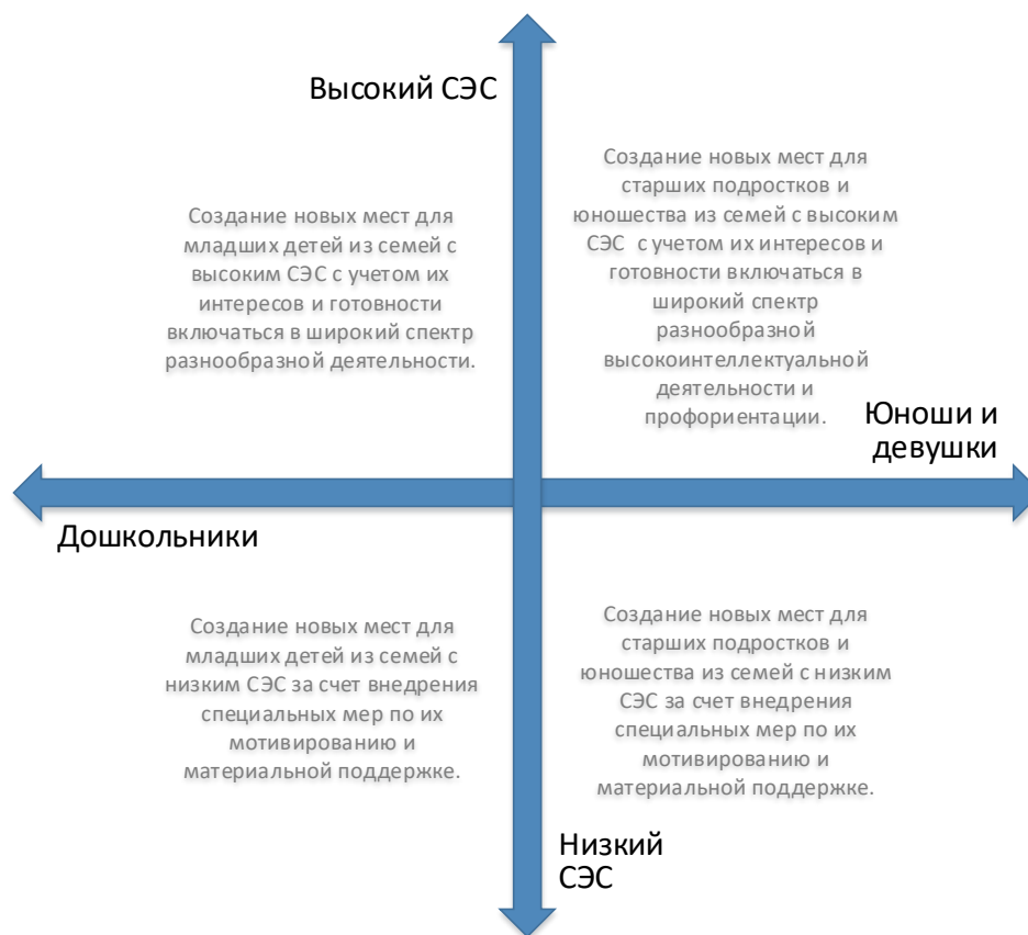
Рис. 5. Шкалы выбора модели создания новых мест по программам физкультурно-спортивной направленности с учетом особенностей контингента обучающихся

Вовлечение в программы детей из семей с низким образовательным и культурным уровнем потребует осуществления определенных PR-шагов, поиска мотиваторов для данных детей, в том числе материальных.