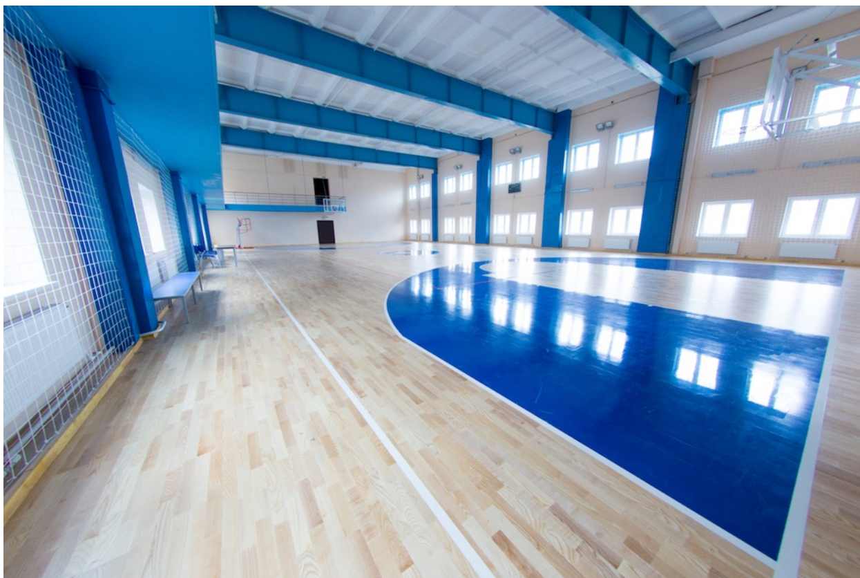
Школьная спортивно-игровая площадка (Лондон)