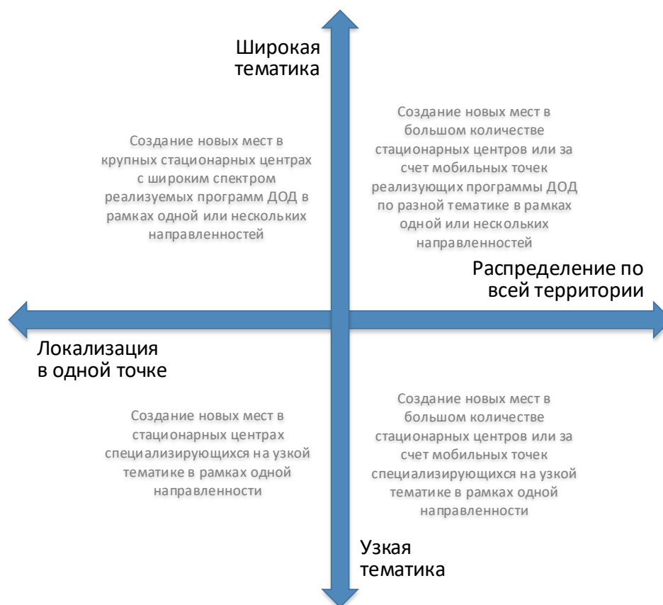
Рис. 3. Шкалы выбора масштаба и формы реализации новых мест по программам ДОД

При невыполнении хотя бы одного из них возникает необходимость пространственного распределения реализуемой модели через мобильные или сетевые решения.