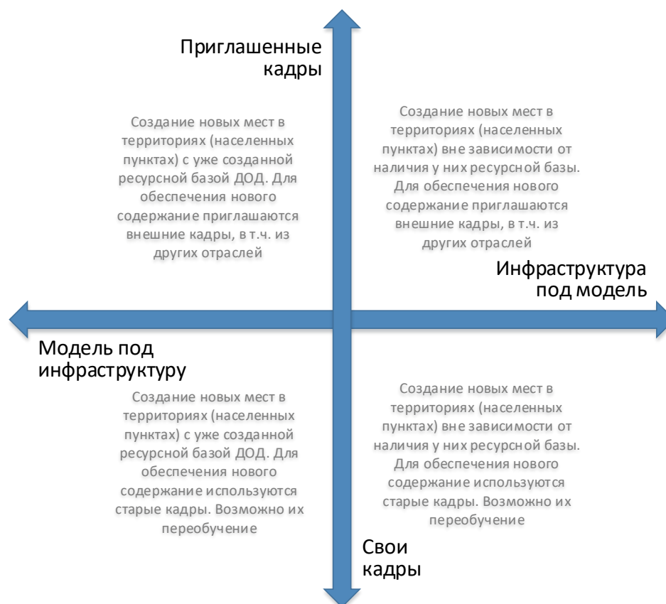
Рис. 6. Шкалы выбора модели инфраструктурного и кадрового обеспечения для типовой модели создания новых мест дополнительного образования

Следует отметить, что механизмы инфраструктурного и кадрового обеспечения не существуют в их полярных вариантах. Решения даже в рамках реализации одной модели будут различны. Анализ перечисленных выше характеристик позволяет сделать эти точечные решения более точными и эффективными.