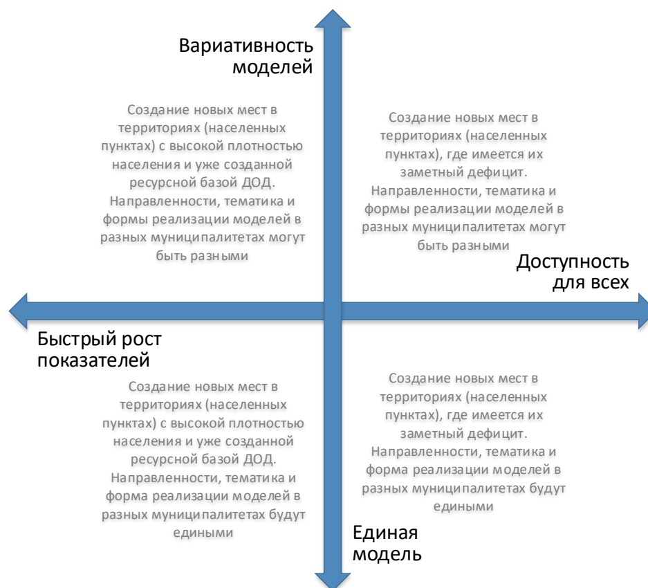
Рис. 4. Шкалы выбора модели создания новых мест с учетом актуальной управленческой политики